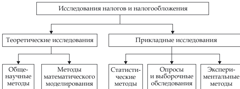
Рис. 3. Методы исследований, применяемые в изучении налогов и налогообложения

Традиционные методы исследований в налогообложении включают: